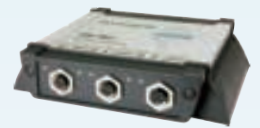
USB-CANmodul2 IP 65