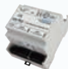
CAN-Ethernet 网关 V2